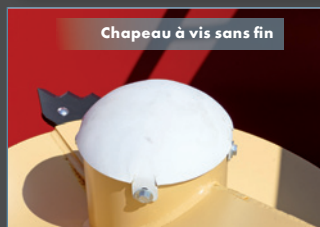
Chapeau à vis sans fin