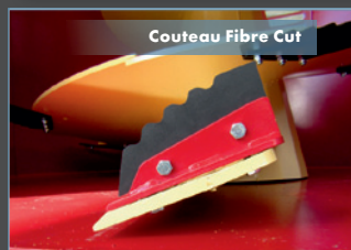
Couteau Fibre Cut