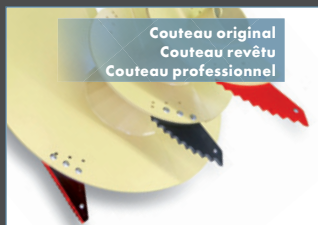
Couteau original Couteau revêtu Couteau professionnel