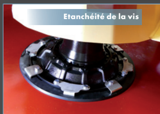
Étanchéité de la vis