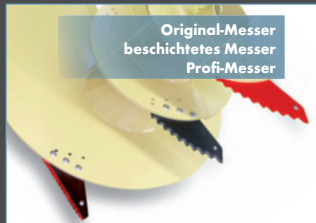
Original-Messer beschichtetes Messer Profi-Messer