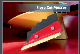
Fibre Cut Messer